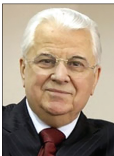
Президент України Леонід Макарович Кравчук 1991–1999 рр.